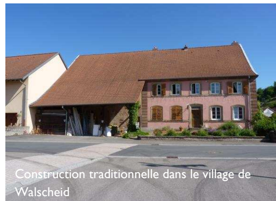
Construction traditionnelle dans le village de Walscheid