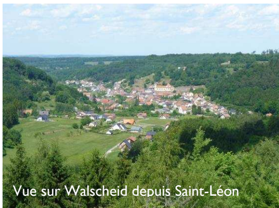
Vue sur Walscheid depuis Saint-Léon