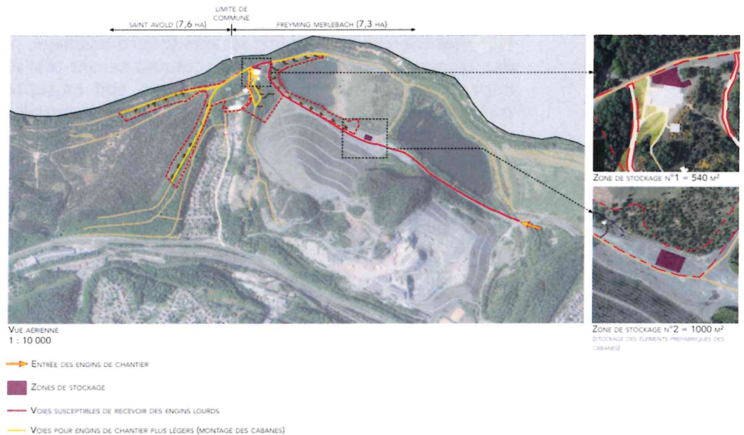
PLAN D'INSTALLATION DE CHANTIER 1 : 10 000

MR1 : mise en place d'une charte de chantier vert et d'un Plan d'Installation de Chantier (PIC) selon le plan ci-dessous.