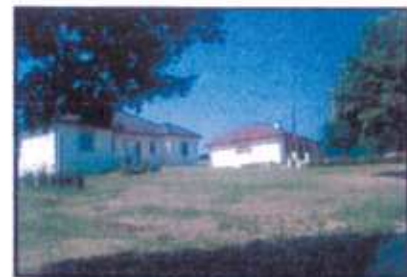
Mixité dans l'habitat

La commune souhaite, dans la mesure du possible, permettre l'installation des jeunes ménages grâce à une offre de logements adaptés à leurs moyens.