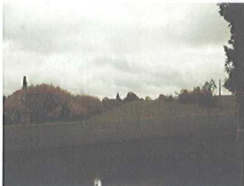
Cône de vue sur le clocher du village depuis la route départementale n°20 sur la limite communale d'Adélanche

Cependant, cette zone étant en hauteur par rapport au cœur ancien du village, elle offre un panorama sur le cœur du village, dont le clocher émerge d'un environnement rural marqué et pittoresque. Il conviendra donc, à travers ce PPM, de préserver ce cône de vue remarquable qui existe depuis la route départementale n°20.