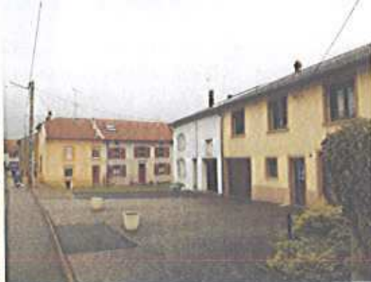
A l'est : la rue des Roses côté nord (en co-visibilité)