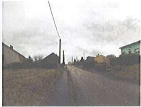
Bâti pavillonnaire, rue des Roses