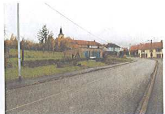
Maisons vues depuis la rue des Roses