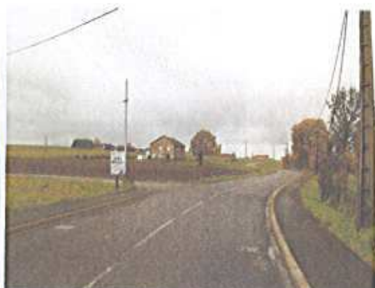
Zone ouverte à l'urbanisation le long de la rue des Roses.