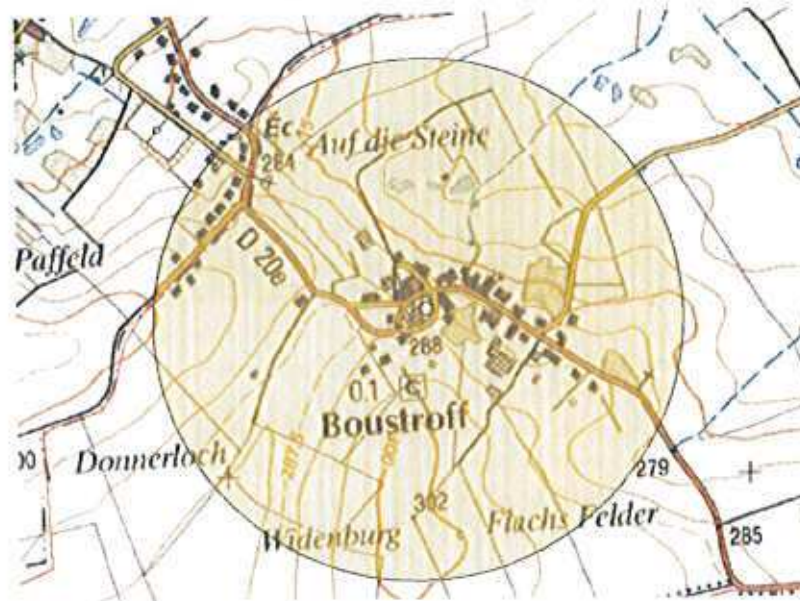
Plan de Boustroff avec le rayon de protection des 500 mètres autour de l'ossuaire.

Le rayon actuel de protection de cet ossuaire englobe à la fois le village ancien, mais également deux zones d'extensions récentes sans rapport avec ce tissu traditionnel et sans véritable valeur architecturale. Le PPM s'orientera donc vers l'exclusion de ces extensions récentes situées au nord-ouest et au sud-est du noyau ancien, tout en préservant cependant le cône de vue paysager sur le clocher depuis la route départementale n°20 venant du nord-ouest.