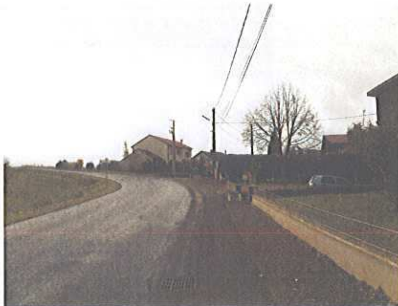
Extensions récentes le long de la rue des Moissonneurs (Adelange)

Cette zone est constituée par des extensions récentes n'ayant aucun intérêt architectural (typologie de « maison isolée au milieu de la parcelle ») le long de la rue du Stade et de la rue des Moissonneurs, marquant la limite communale entre Adelange et Boustroff. Le tout forme déjà un mitage du paysage. Le long de la route départementale n°20, dans la continuité coté Boustroff, une nouvelle zone est ouverte à l'urbanisation, mais elle échappe à la perspective sur le bourg évoquée dans le chapitre 1.4.