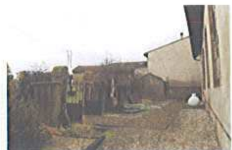
Ossuaire de Boustroff (classé monument historique) : Le bâtiment dans son environnement proche