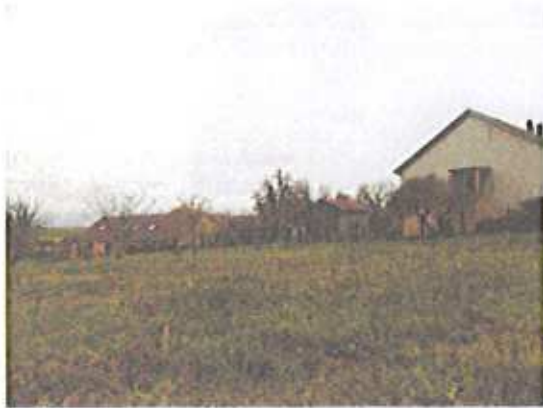
Lotissement le long de la rue des Vergers

Ces zones pavillonnaires (bâti des années 1970 à nos jours) ne présentent aucune co-visibilité directe avec le monument historique et sont constituées exclusivement de bâti non continu, en cœur de parcelle et de type lotissement, sans lien avec le bâti traditionnel du cœur de village.