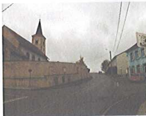
L'enclos paroissial depuis la rue des Roses

Aux abords immédiats du monument historique, le tissu urbain est composé principalement de constructions du XVIII e et XIX e siècle : rue des Roses, rue des Prés et rue des Marronniers. Dans la continuité de la rue des Roses au sud-ouest, après l'intersection de la rue des Vergers, l'on trouve aussi des extensions récentes, poches de tissus pavillonnaires avec une trame urbaine plus aérée.