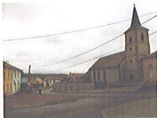
La rue des Roses à l'est de l'enclos paroissial