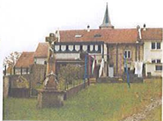
Extensions récentes visibles depuis la rue des Près