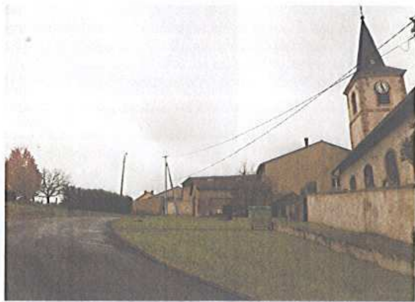
Champ direct de visibilité depuis la rue des Marronniers

Il existe un champ direct de visibilité et une covisibilité limités aux vues des dimensions restreintes de l'ossuaire et de son implantation à l'arrière du mur de clôture de l'enclos de l'église.