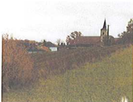
Perspective sur le clocher depuis la RD20.

Cette zone rurale, légèrement en pente douce, offre un panorama paysager pittoresque vers le cœur du village qui se caractérise par son clocher. Cette perspective, principalement perceptible sur le coté gauche de la route départementale n°20, est à conserver. En approchant du village, la route départementale prend le nom de rue des Roses. Le tissu urbain est là encore très lâche, bien qu'ouvert à l'urbanisation. Il est nécessaire de conserver cette zone sensible, véritable entrée du village.