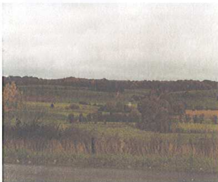
Vue sur les zones naturelles (Bruhltrisch) depuis la route départementale n°20.

Il s'agit des zones naturelles se situant en dehors des limites des zones constructibles de la carte communale (Donnerloch, Widenburg, Flachsfelder, Ahtenborn, Boneben et Bruhltrisch). Cette délimitation définie par la carte communale permet de sauvegarder cet espace de toute urbanisation.