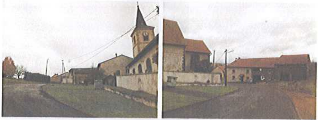
La rue des Marronniers, vue vers l'ouest et vers l'est, en champ direct de visibilité.