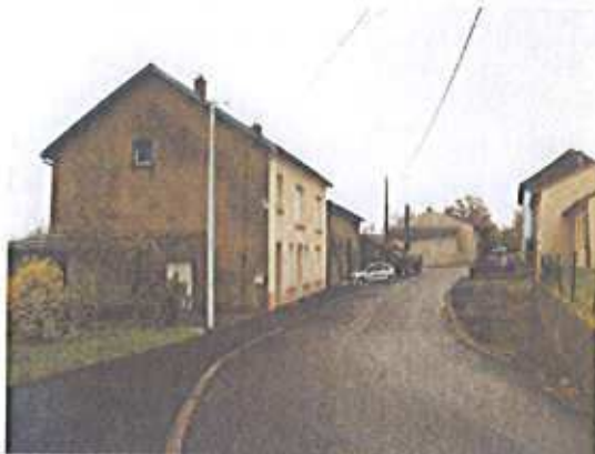
Maisons dans la rue des Près

Formant une petite boucle, la rue des Près présente la même typologie de bâti que dans les rues des Roses et des Marronniers, c'est-à-dire des corps de fermes et des granges. Quelques maisons et extensions récentes ont cependant été construites dans ce tissu urbain assez lâche, à proximité immédiate de l'enclos paroissial.