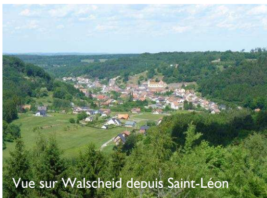
Vue sur Walscheid depuis Saint-Léon