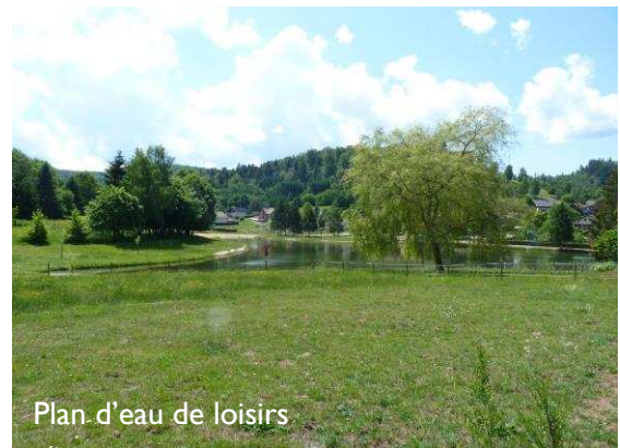
Plan d'eau de loisirs