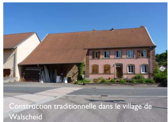
Construction traditionnelle dans le village de Walscheid