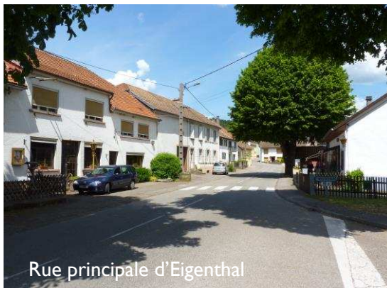
Rue principale d'Eigenthal