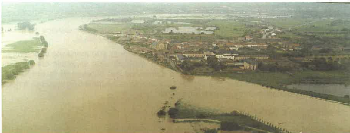
Commune de Rettel – Crue de mai 1983