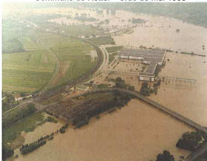
Commune de Rettel – Crue de mai 1983