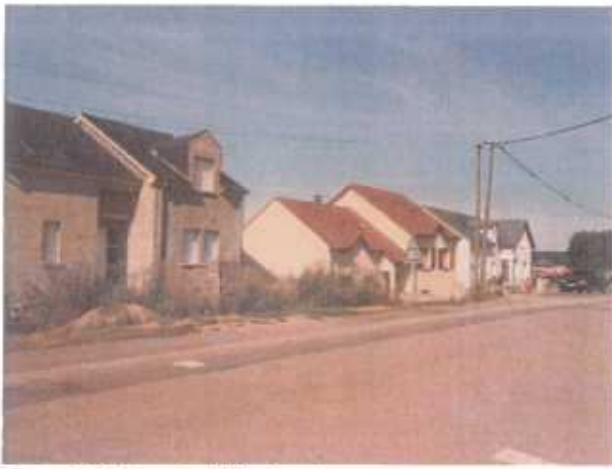
Route de Vatimont – Bâtiés récents