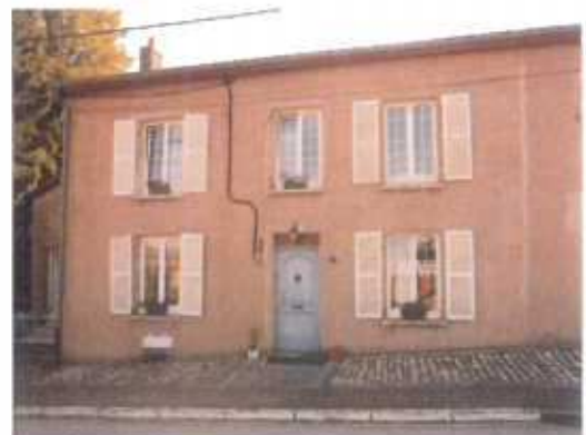
Maison de la première moitié du XIX e siècle