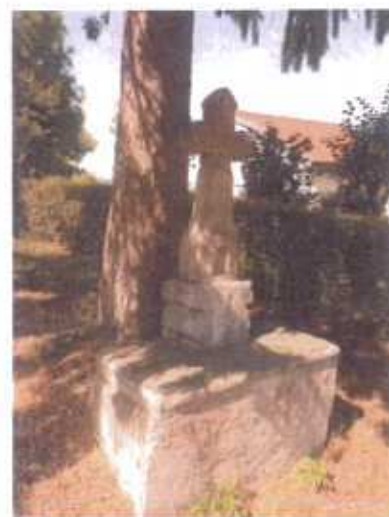
Croix de chemin