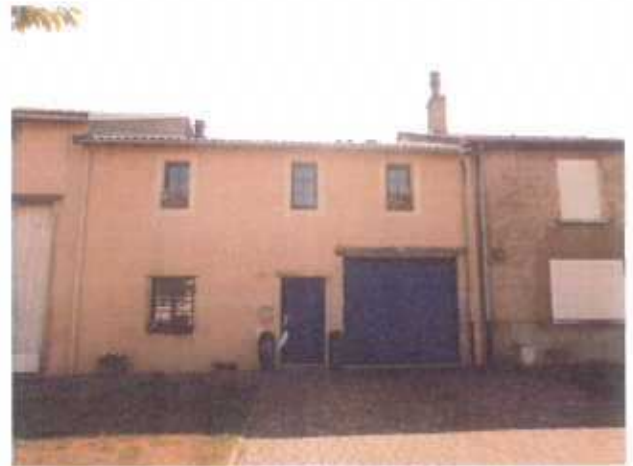
Rue Principale – Construction du XIX e siècle