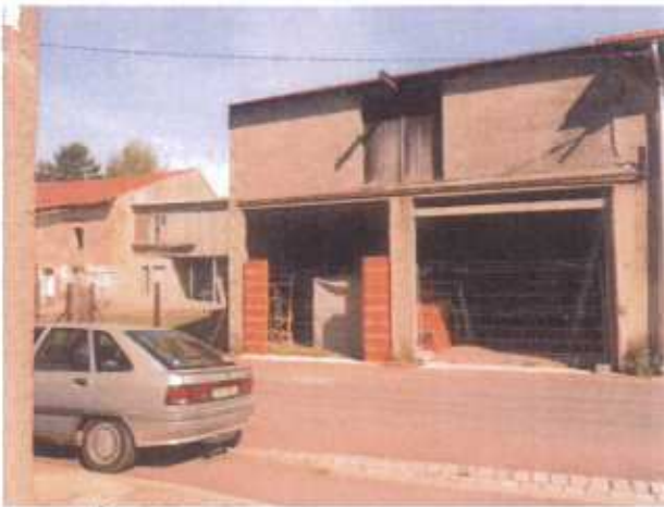
Rue de l'Étang – Bâtiment inachevé

Ces zones ne présentent plus aucune covisibilité directe avec le monument historique. Bien qu'il existe de nombreuses constructions lorraines anciennes avec usoirs sur rue, nombre d'entre elles ont été dénaturées par des aménagements inadéquats (menuiseries en plastique sur des constructions anciennes, éléments en pierre de taille camouflés, application de teintes de façades étrangères aux couleurs mosellanes, etc.) et par le caractère inachevé de bâtis plus récents (parpaings non enduits, tôle ondulée en guise de couverture, etc.)