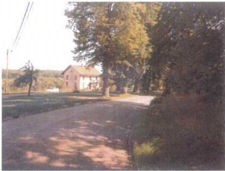
Espaces environnant la gare