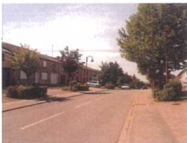
Trame urbaine ancienne avec bâti de la Reconstruction dominant