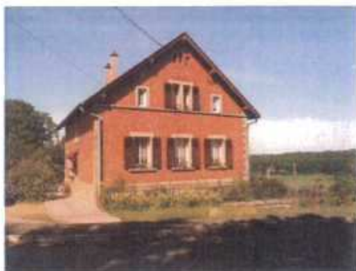
Pavillon en brique du début du XX e siècle

Aux abords immédiats du monument historique, le tissu urbain est composé de quelques constructions du XIX e siècle et de la période de la Reconstruction : rue de la Gare et rue de Seutry, mais aussi des extensions récentes, poches de tissus pavillonnaires avec une trame urbaine plus aérée.