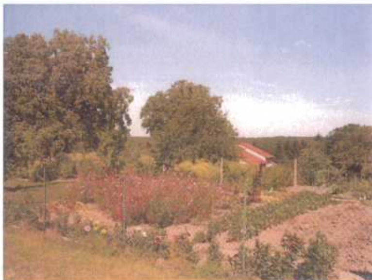
Vue sur potager et espaces fleuris

Par ailleurs, cette zone offre de nombreuses perspectives paysagères remarquables sur des vergers, des potagers, ou sur l'esplanade de la gare qu'il convient de préserver. Il est à noter également que des vues paysagères plus lointaines au Nord, au delà de la voie ferrée ont l'avantage d'offrir un panorama intéressant sur des espaces arborés, des bocages, des collines à pente douce, des pâturages et des champs non parasités visuellement par des ouvrages techniques (pylônes, lignes électriques, postes électriques, etc.). Tous ces éléments témoignent d'un environnement rural de qualité qu'il faudra conserver.