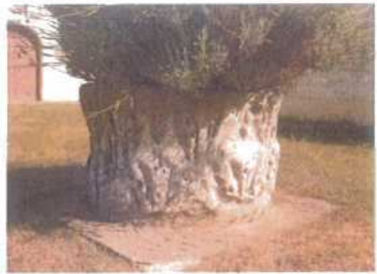
Chapelle du Seutry et margelle de puits (ISMH) Détails sculptés érodés du monument historique

Le rayon actuel de protection de cette margelle de puits englobe à la fois une partie du village ancien, mais également des zones d'extensions récentes sans rapport avec ce tissu traditionnel et sans véritable valeur architecturale. Le PPM s'orientera vers l'exclusion des extensions récentes et des maisons formant un mitage des paysages au sud-est du village.