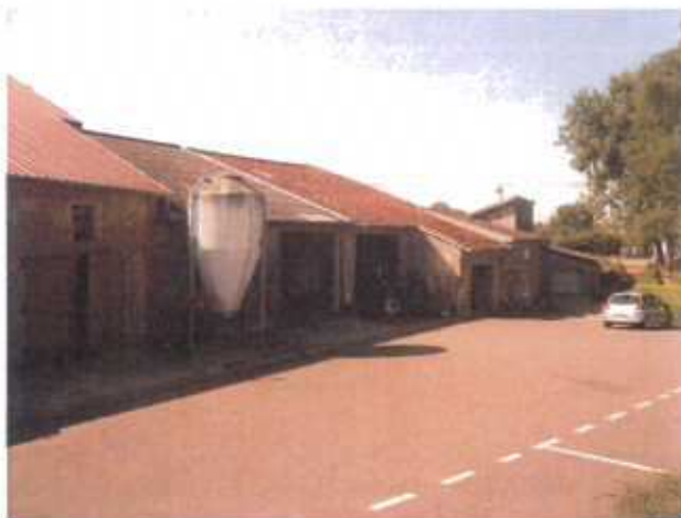
Rue Principale, constructions inachevées et silos sur rue

De plus, de nombreux travaux ne respectant pas les caractéristiques architecturales traditionnelles au cœur du village ont entraîné une dénaturé du bâti ancien.