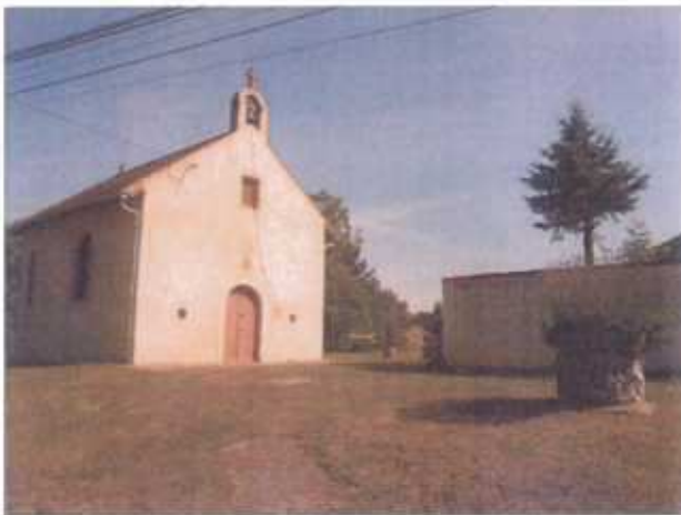
Chapelle du Seutry

Cet espace urbain présente des cônes de visibilité directs avec le monument, avec quelques bâtiments anciens intéressants qu'il convient de préserver. De plus, ce secteur renferme quelques éléments patrimoniaux de qualité : chapelle du Seutry, maison du garde-barrière, croix de chemin, abreuvoir, calvaire. Par ailleurs, une trame verte vient enrichir cette aire plaisante (arbres isolés de haute tige, espaces fleuris, potagers, haies horticoles, panoramas sur campagne, pelouses entretenues...)