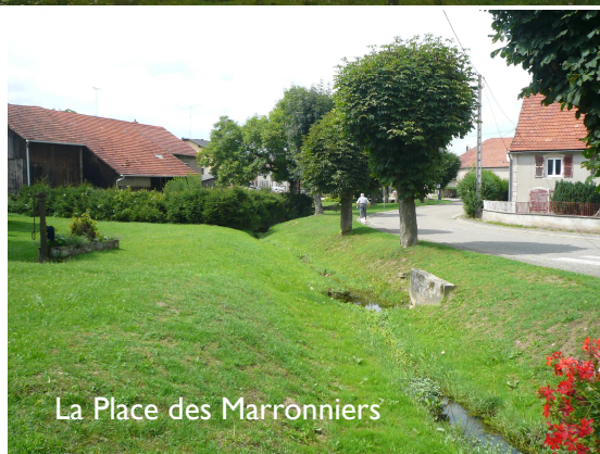
La Place des Marronniers