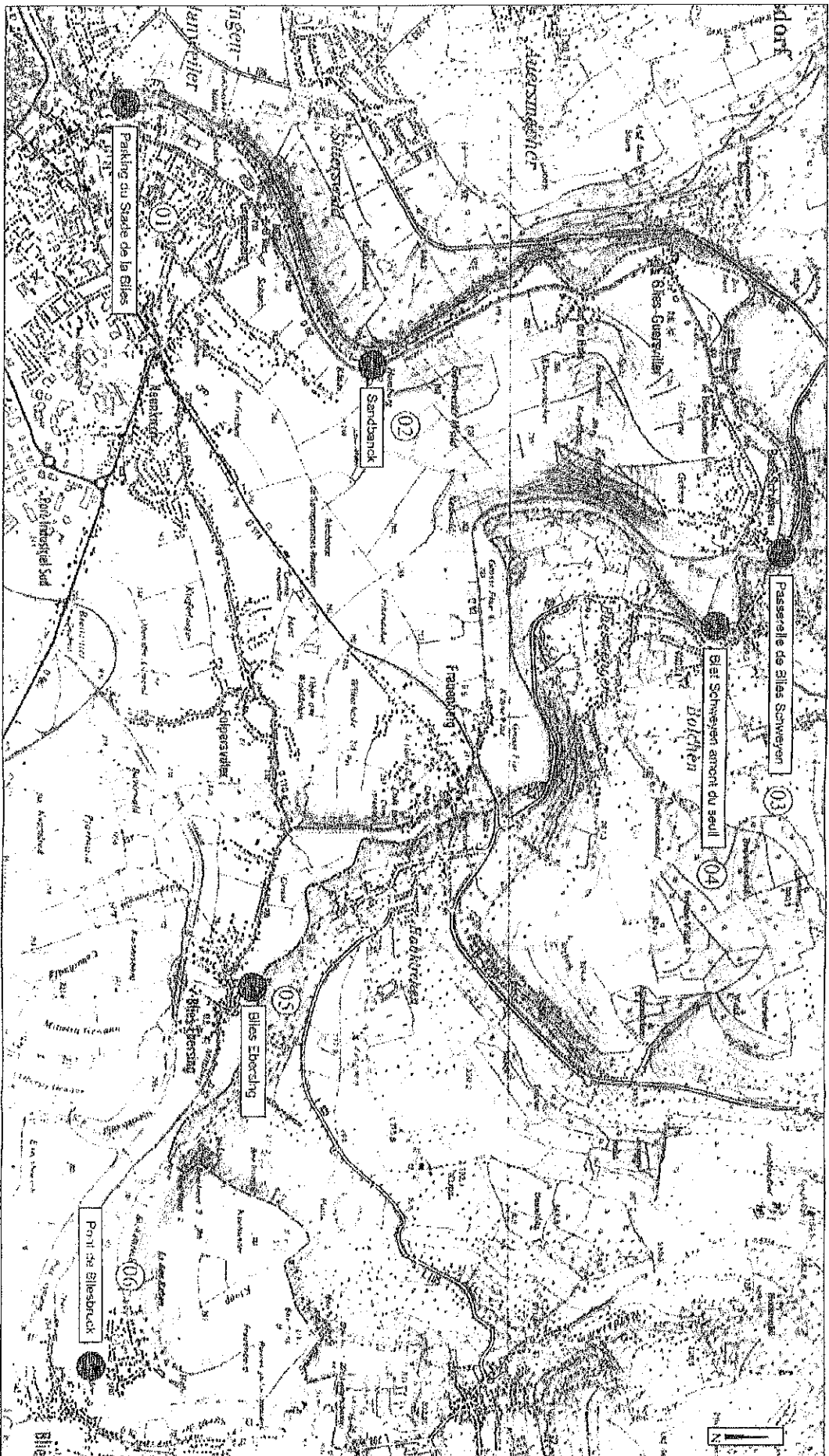
Figure 1 : Plan de situation

Le projet se situe sur la Bils, entre Bilsbruck et Sarreguemises.