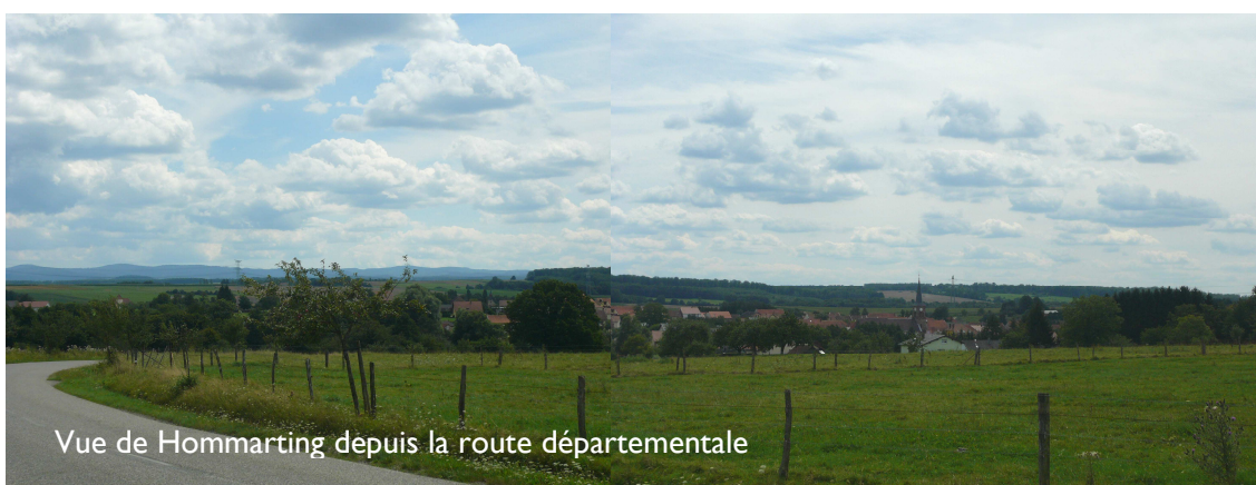
Vue de Hommaring depuis la route départementale