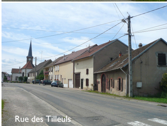
Rue des Tilleuls