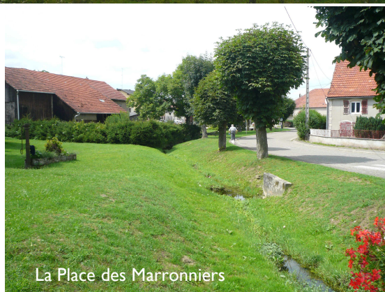
La Place des Marronniers