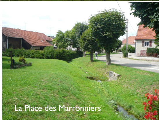
La Place des Marronniers