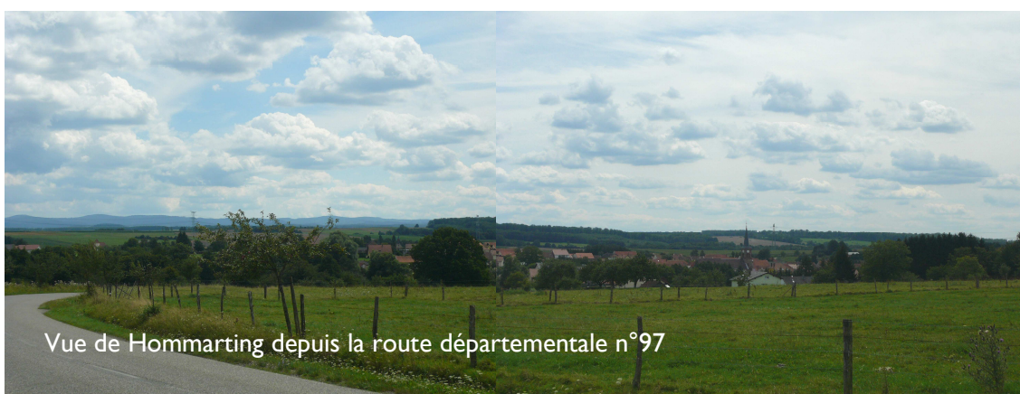
Vue de Hommaring depuis la route départementale n°97