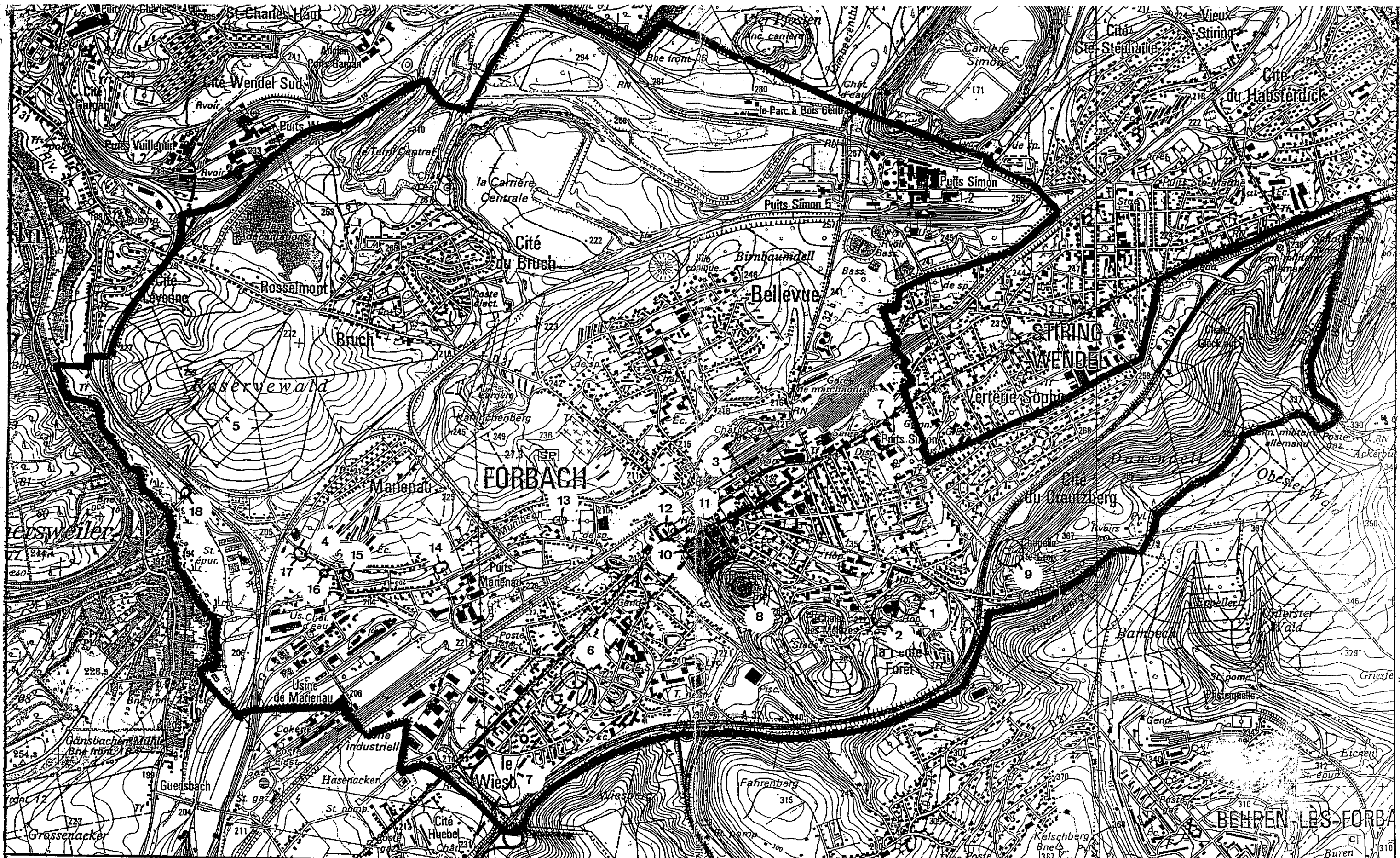
Carte de répartition des sites archéologiques. indices de sites et vestiges du patrimoine localisés sur la commune de Forbach, 57.

Carte Archéologique de Lorraine, S.R.A. Metz, mars 1994.