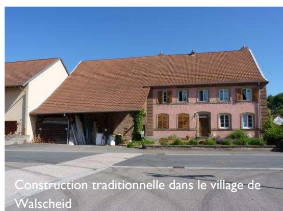
Construction traditionnelle dans le village de Walscheid