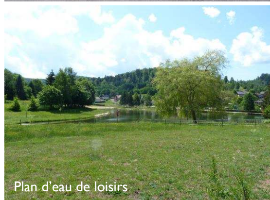
Plan d'eau de loisirs