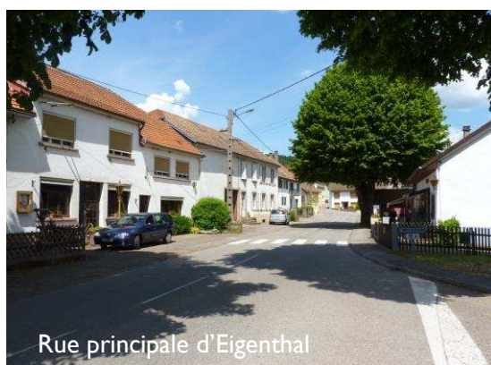
Rue principale d'Eigenthal