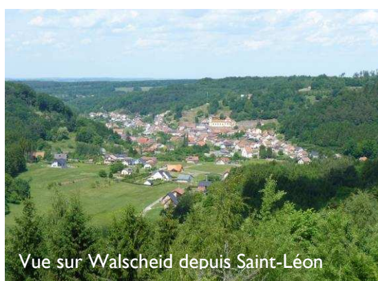
Vue sur Walscheid depuis Saint-Léon